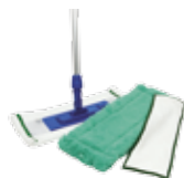
Швабра для пола со сменными насадками Opti-Set