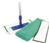
Швабра для пола со сменными насадками Opti-Set